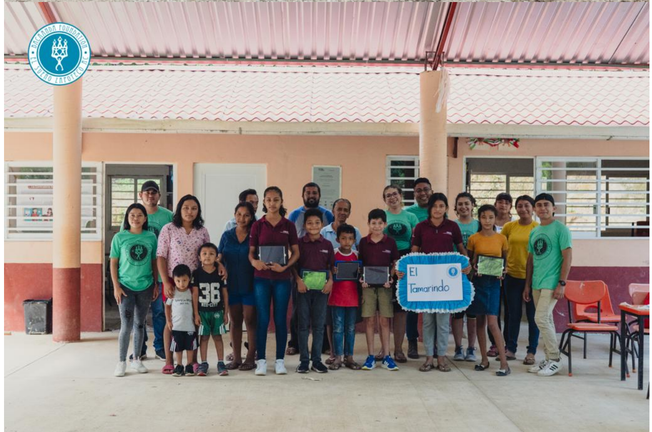
Entrega de iPads