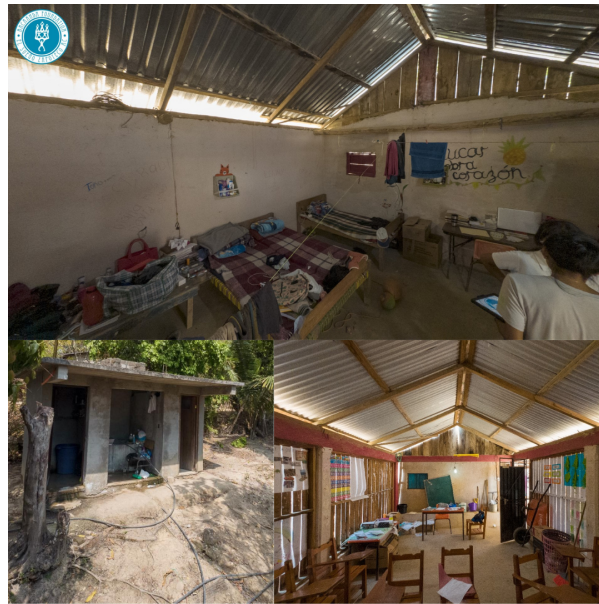
Cerro Clanes Magdalena, Pochutla

Hemos alcanzado casi el 25% de nuestro objetivo de $50,000 dólares, pero nos queda mucho camino por recorrer.